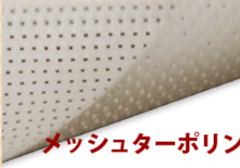
メッシュターポリン